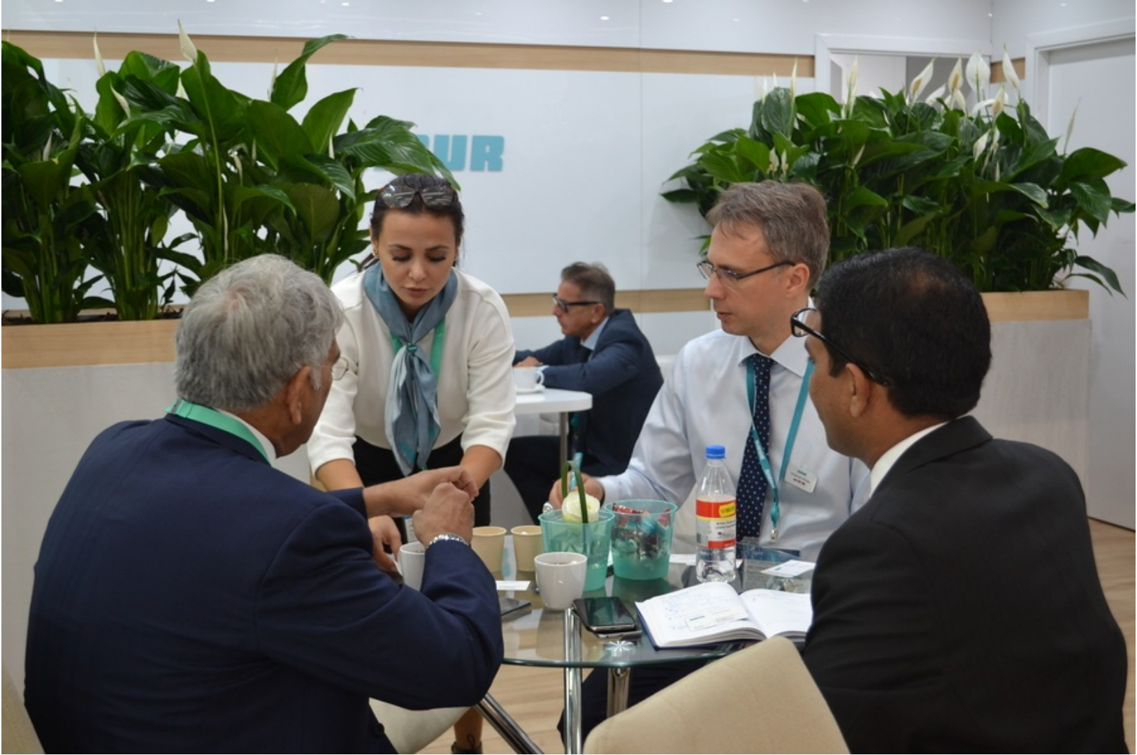
Стенд СИБУРа на выставке K2019.